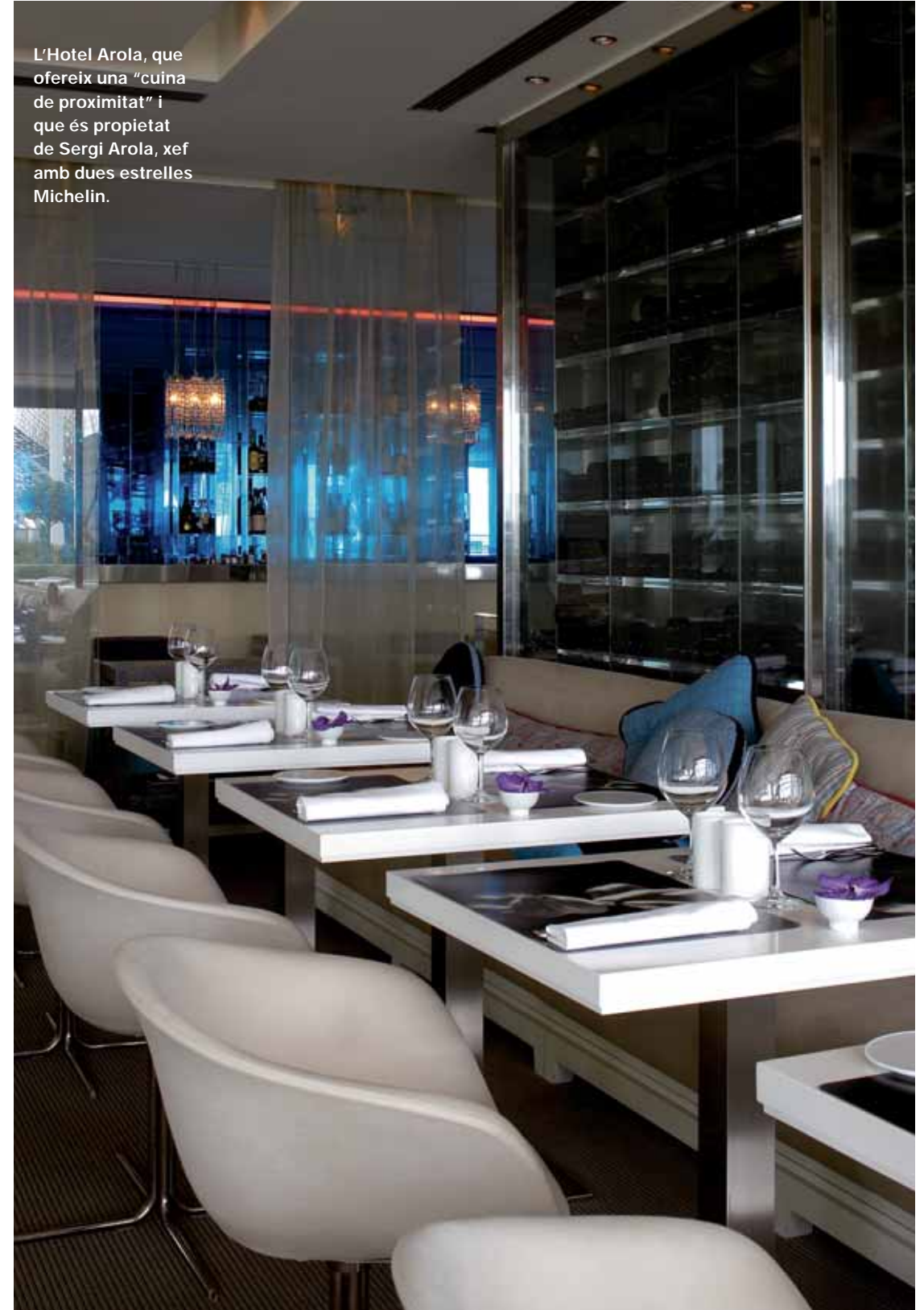
L'Hotel Arola, que ofereix una "cuina de proximitat" i que és propietat de Sergi Arola, xef amb dues estrelles Michelin.

estar en una altra dimensió que no és la que et correspon, com viure en un núvol que saps que s'acabarà a partir de les dotze del migdia del dia següent quan tornis a la realitat". I és que regalar una nit a l'hotel Arts per un aniversari o per la nit de noces és una aposta segura. En l'actualitat per quasi quatre-cents euros es pot disposar d'una nit en habitació estàndard (no inclou l'esmorzar) en temporada baixa. Les bones sensacions que deixa en els seus clients explica l'alta ocupació de les seves instal·lacions al llarg de l'any, que se situa al voltant del 70-75%. "Això és molt per a un hotel de 483 habitacions", assegura Rosemary Trigg, qui recorda que el Ritz,