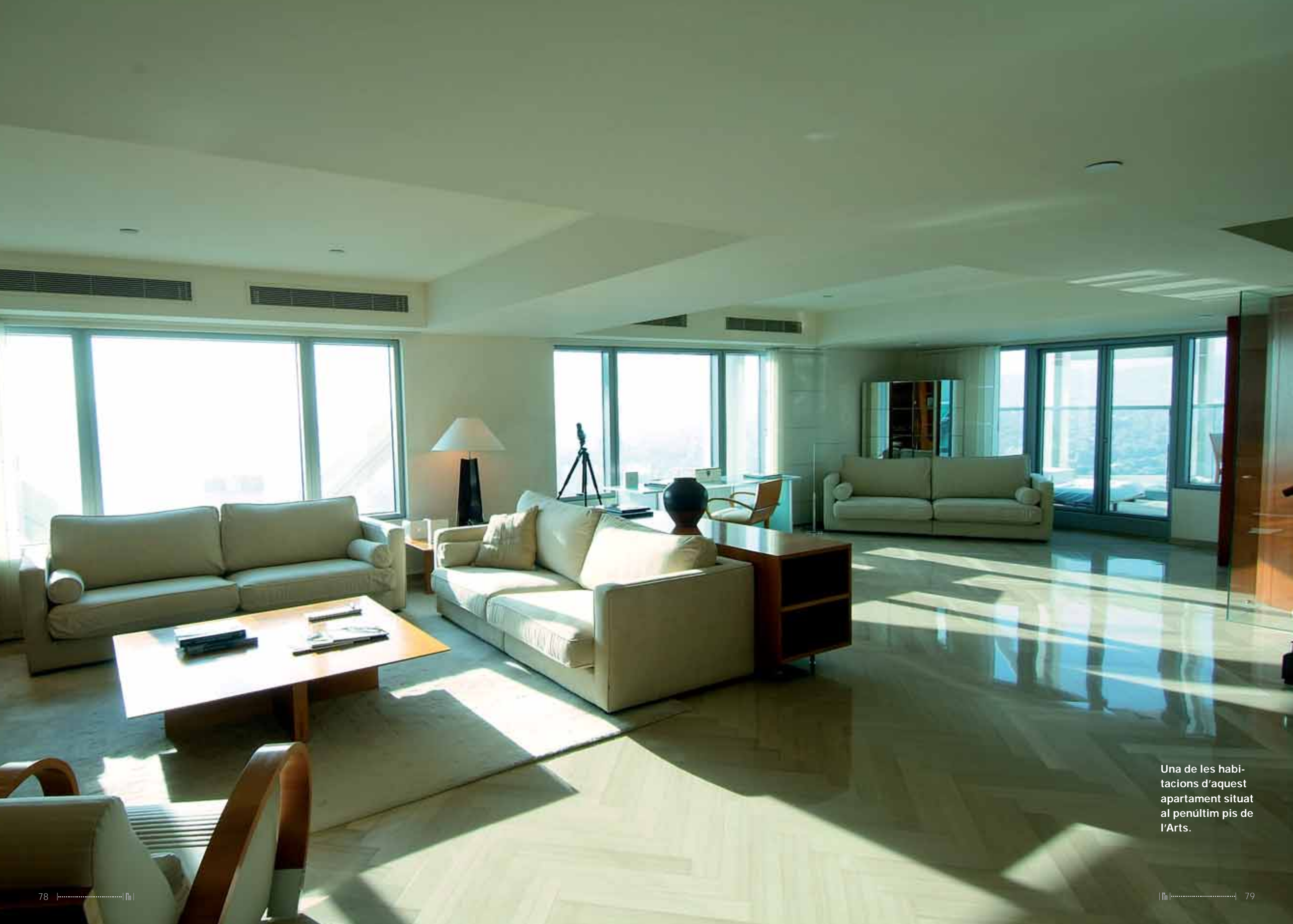
Una de les habitacions d'aquest apartament situat al penúltim pis de l'Arts.