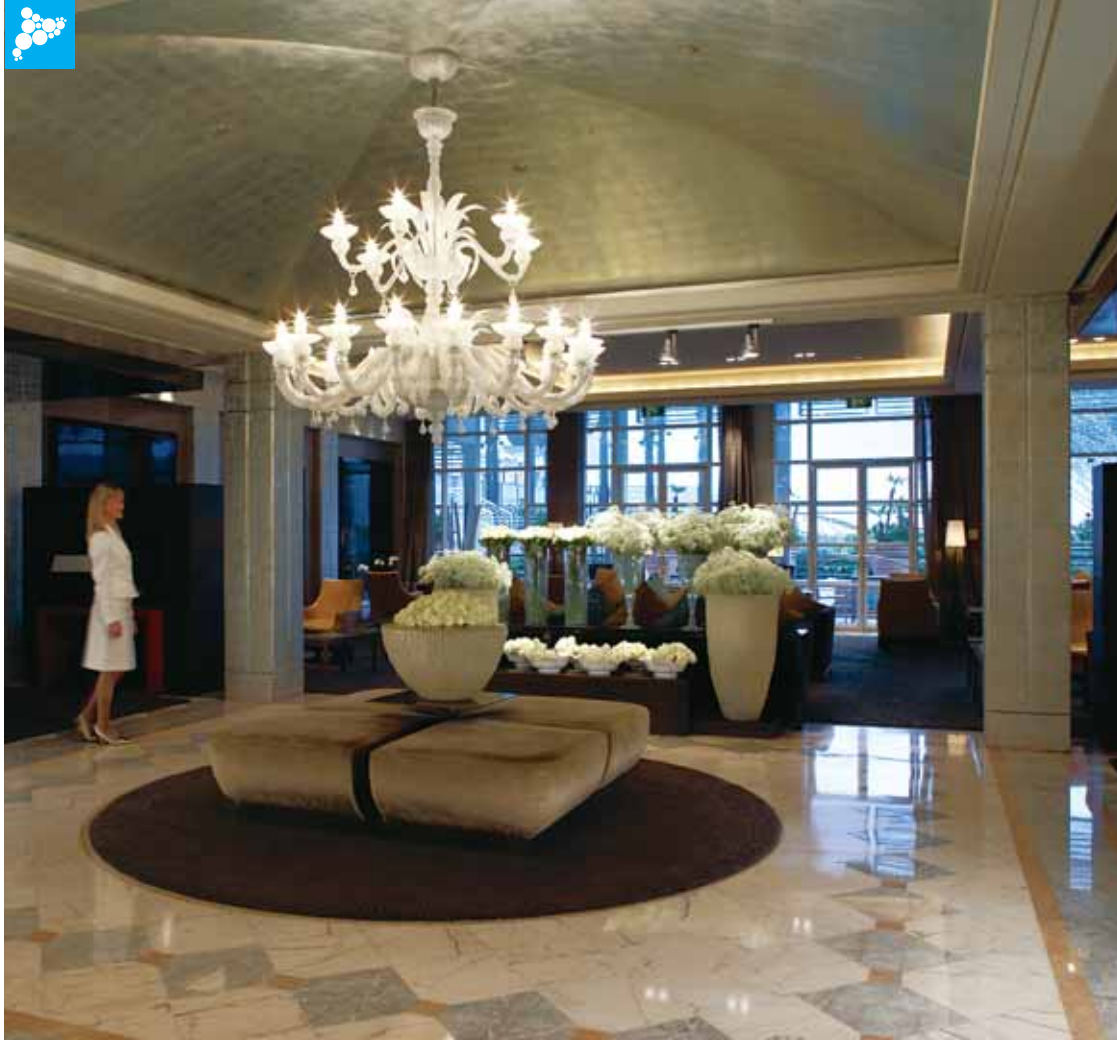
Vestíbul principal de l'Hotel Arts

estratègicament ubicades a les cantonades on es gaudeix de les millors vistes, hi ha les suites. Però malgrat el gran nombre d'habitacions, l'hotel està organitzat de tal manera que fa la sensació de ser molt més íntim del que inicialment podria semblar. Aquí no hi ha passadissos interminables i la logística permet que per anar a qualsevol habitació no calgui passar per davant de més de tres portes.