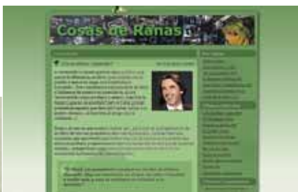
El diari Cosas de Ranas , que rep mil visites diàries, ha rebut un premi dels lectors de 20 Minutos com a millor bloc d'actualitat.

Uns 23 milions de persones, segons els experts, tenen un bloc, i la xifra de lectors ja supera els cent milions. Diàriament, neixen 75.000 bitàcoles a la xarxa i no sembla que aquest boom s'hagi d'aturar, ja que el nombre