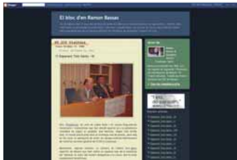
Les portades dels blocs de dos maresmencs força visitats: el regidor Ramon Bassas i el periodista Saül Gordillo.