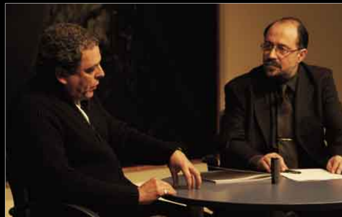
Perecoll i Pic en un moment de la conversa a l'Ateneu. A l'altra pàgina, l'artista posant davant d'un dels seus quadres.

P. C.: En l'escultura és tan important el buit