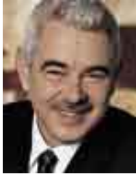
PASQUAL MARAGALL President de la Generalitat de Catalunya

Em sento complagut de poder-me afegir a la celebració del vintè aniversari de la revista Capgròs . Sempre és motiu de satisfacció tot allò que representi avançar en la pluralitat informativa dels ciutadans i ciutadanes de Catalunya.